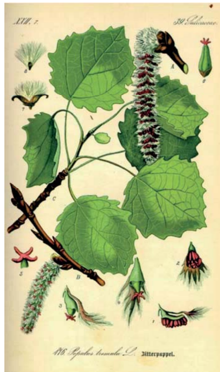
Abb. 1: Botanische Zeichnung von Zitterpappeltrieben ( Populus tremula L.) inklusive Blättern, Blüten und Fruchtsansätzen (Thomé 1885)

Ihre im Vergleich mit anderen Pappelarten größere Standortamplitude lässt sie auf den unterschiedlichsten Böden wachsen (Hofmann 2010, Liesebach et al. 2012). Jedoch können Zitterpappeln durch ihre Genügsamkeit im Hinblick auf den Nährstoffbedarf das Nährstoffpotenzial besser versorgter Standorte nicht voll ausnutzen (Hofmann 2010). Auch kumuliert das Wachstum der Zitterpappel im direkten Vergleich mit anderen Pappelarten später (Liesebach et al. 2012). Für die erfolgreiche Kultur von Aspen empfehlen Traupmann (2004) und Weisgerber (1980) bei ausreichender Wasserversorgung eine Mindestbodenpunktzahl von 30.