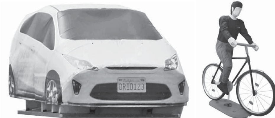
Figure 6: Testing advanced AEB systems in more complex traffic scenarios requires further advances in testing technology, such as 3D vehicle and cyclist targets

able road users, pedestrians and (motor) cyclists, in terms of vehicle design measures and especially crash avoidance technologies.