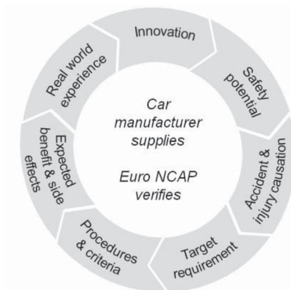
Figure 4: The “Beyond NCAP” methodology requires that the vehicle manufacturer presents a detailed step-by-step analysis of the innovation’s potential safety impact, based on accident data and test results

Since 2010, Euro NCAP has been rewarding vehicle manufacturers that make available new technologies which have a scientifically proven safety benefit for consumers and society but are not yet considered in the rating scheme (Van Ratingen et al., 2011). Many of these technologies focus on avoiding crashes by informing, advising, alerting or supporting drivers in dangerous situations. Recognizing these advances under Euro NCAP Advanced provides an incentive to manufacturers to accelerate the availability of new safety equipment across their model ranges, helps vehicle buyers factor these features into their purchasing decisions.