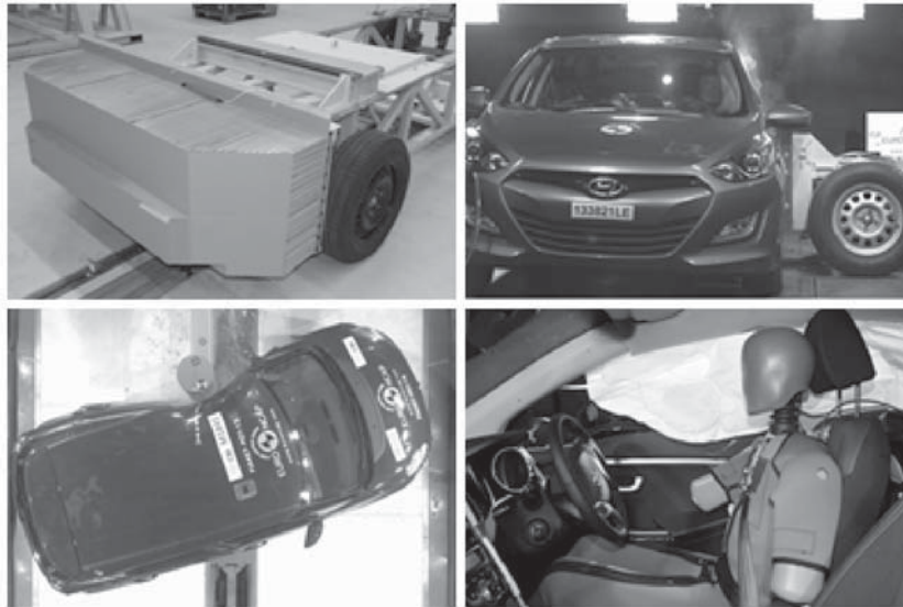
Figure 1: The updated Euro NCAP side impact crash tests using the Advanced European Mobile Deformable Barrier (AE-MDB) and the WorldSID mid-sized male dummy