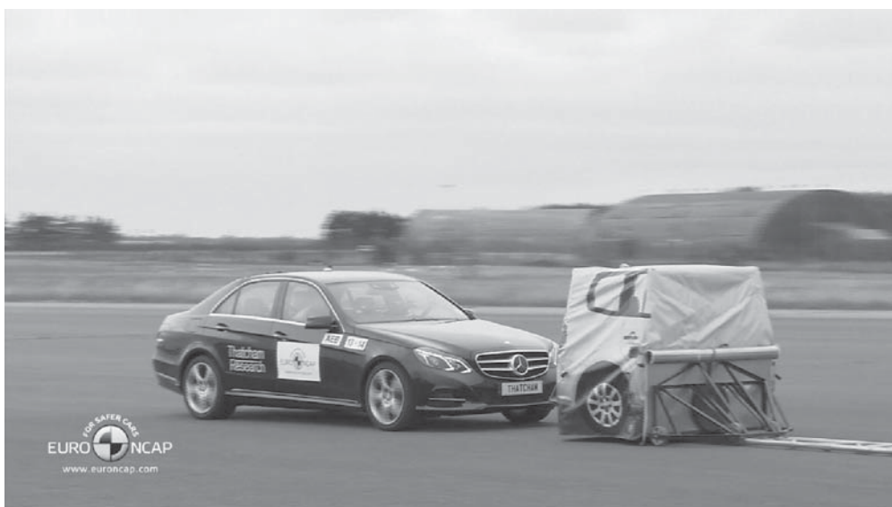
Figure 3: Euro NCAP started to assess AEB systems in 2014 using specially designed “impactable” vehicle target and test equipment

Following the start of the ESC track testing in the rating scheme in 2011, the assessment of Speed Limitation devices was broadened in 2013 to include intelligent Speed Assistance Systems which employ digital mapping and/or speed sign recognition (Schram et al., 2013).