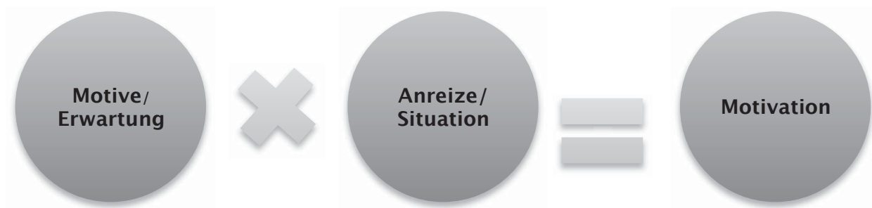
Abbildung 2: Motivation als ein Produkt aus Motiv und Anreiz (Heckhausen, 1989)

Motivation kann als ein Produkt aus individuellen Merkmalen von Menschen, plus ihren Motiven und den Merkmalen einer aktuell wirksamen Situation, in der Anreize auf die Motivation einwirken und diese aktivieren, bezeichnet werden (Heckhausen, 1989). Der “Faktor Motive” wird als die Bedürfnisse, Interessen und Erwartungen einer Person bezeichnet, während der zweite Faktor die “Situation”, der für die “Motivation” ausschlaggebend ist, sich mit “Anreizen und Anforderungen” an die Organisation definieren lässt (Sturm et al., 2011).