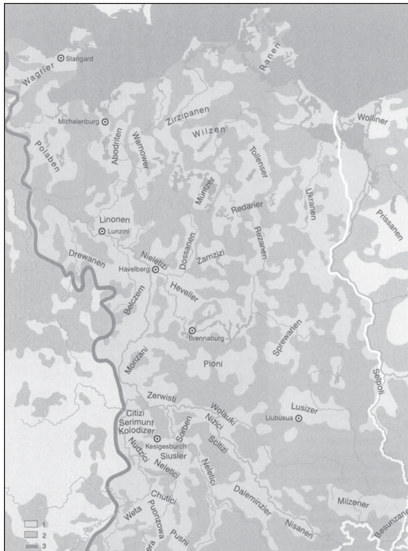
Abb. I: Die slavischen Siedlungsgebiete um 1000. Aus: GRINGMUTH-DALLMER: Siedlungslandschaften, S. 97.

Während die einzelnen slavischen Gruppierungen zwischen Saale, Erzgebirge und Neiße etwa seit der Mitte des 10. Jahrhunderts grundsätzlich die westliche Herrschaft anerkannten, unterstanden die nördlichen gentes zwischen Elbe, Ostsee und Oder mindestens bis zur Mitte des 12. Jahrhunderts weder in politischer noch in kirchlicher Hinsicht dauerhaft dem Reich. Erste Versuche einer Christianisierung waren nach den großen Aufständen von 983 und 1066 gescheitert. Erst zu Beginn des 12. Jahrhunderts intensivierten die lokalen und regionalen Gewalten an der Ostgrenze des Reiches die Versuche, dem Anspruch der Könige und Kaiser auf die Oberherrschaft über die slavischen gentes oder dem Christentum den bereits gegründeten Bistümern Geltung zu verschaffen.