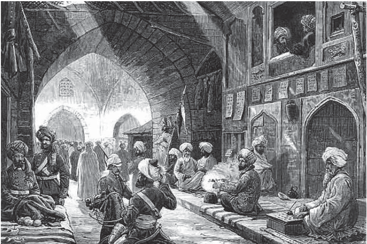
Abbildung 4: Kandahar-Basar 1839. Links vor den Läden sitzen einige englische Offiziere. Die rechts sitzenden Kandahari scheinen nicht beeindruckt zu sein. Unbekannter britischer Künstler.