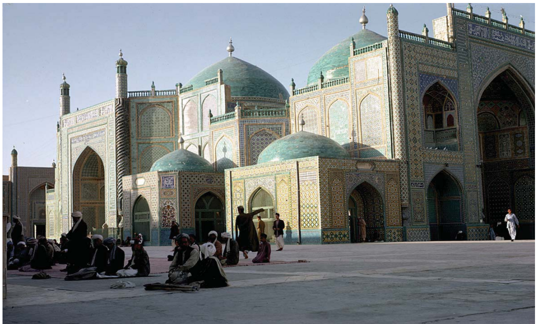
Abbildung 3: Das Mausoleum des vierten rechtgeleiteten Kalifen Ali in Masar-e-Sharif, erbaut zur Zeit von Sultan Hussain Baiqara 1500.