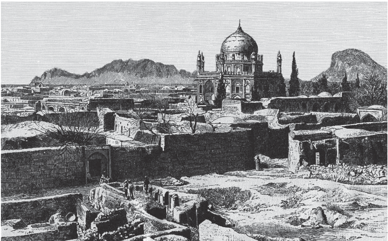
Abbildung 5: Die Stadt Kandahar 1842 nach einer Beschießung durch General Nott. Das Mausoleum Ahmad Schahs hat die Beschießung überstanden. Die fassungslosen Kandahari schauen auf die Ruinen ihrer zerstörten Häuser. Unbekannter britischer Künstler.