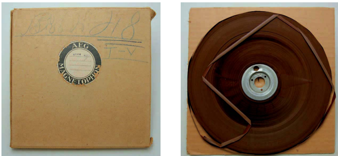
Abb. 2 (linke Seite) und 3 (rechte Seite): Typisches Band der Sammlung Armando Leça. Links die Tonbandschachtel und rechts das Tonband im Originalzustand (Schäden durch Vinegar-Syndrom und Versprödung sind bereits sichtbar).

Diese frühen Tonbänder waren qualitativ noch nicht sehr hochwertig; Schwachstellen betrafen die ungleichmäßige Beschichtung, mangelhafte Aussteuerbarkeit sowie eingeschränkte elektromagnetische und mechanische Eigenschaften. Dies äußert sich in der Signalqualität durch Rauschen, Verzerrungen und inhomogenes Verhalten über den Bandquerschnitt.