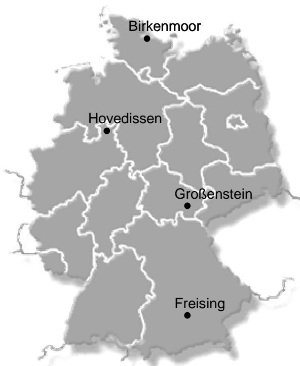
Abb. 1: Versuchstandorte im bundesweiten Rapsmonitoring

Die in den Jahren 2004-2007 durchgeführten dreijährigen Feldversuche sind an vier Standorten in Zusammenarbeit mit dem Pflanzenschutzamt des Landes Schleswig-Holstein in Birkenmoor (Schleswig-Holstein), der Norddeutschen Pflanzenzucht Hans Georg Lemke KG in Hovedissen (Nordrhein Westfalen), der Thüringischen Landesanstalt für Landwirtschaft in Großenstein (Thüringen) sowie der Bayerischen Landesanstalt für Landwirtschaft in Freising (Bayern), in Regionen mit intensivem Rapsanbau etabliert worden. Auf diesem Weg war ein vollständiger Eindruck über die standort- und jahresspezifischen Einflüsse auf die Epidemie- und Schadensdynamik des Erregers Leptosphaeria maculans / Phoma lingam im gesamten Bundesgebiet gewährleistet. Die räumliche Verteilung der Standorte im Bundesgebiet ist in Abbildung 1 dargestellt.