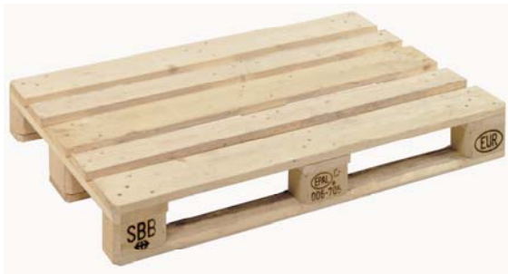
Abbildung 1: EUR/EPAL-Palette 6

Im Jahre 1961 einigten sich verschiedene europäische Eisenbahngesellschaften auf einen Vertrag, der vorsah, eine standardisierte, tauschbare Palette im Format 800 x 1'200 mm einzuführen. Diese Palette ist bis heute auch unter dem Namen "Europalette" bekannt (vgl. Abbildung 1).