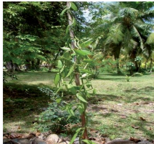
Abb. 2: Vanillepflanze/Seychellen (4)

Die Anbauversuche waren aber zunächst nicht erfolgreich, da außerhalb Mexikos die Bienen aus der Familie der Meliponen und die Kolibris weitgehend fehlten und somit keine natürliche Befruchtung stattfinden konnte.