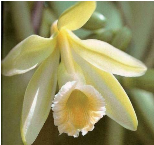
Abb. 1: Vanilleblüte (1)

Die Gewürzvanille, eine Orchideenpflanze, hat ihren Namen vom spanischen vainilla (kleine Hülse oder Schote, zu lat. vagina ). Der zweite Teil des Artnamens, planifolia , bezieht sich auf die flachen Blätter (lat. planus = flach) und ( folium = Blatt). Sie ist heimisch im östlichen Mexiko und vielfach in den Tropen kultiviert. Im 16. Jahrhundert gelangte die Pflanze durch die Spanier erstmalig nach Europa, die Franzosen transportierten sie in ihre tropischen Kolonien im Indischen Ozean und die Holländer brachten sie nach Java.