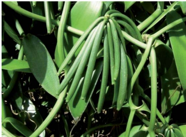
Abb. 6: Vanillepflanze mit Schoten (3)

Reihen pflanzt man meist die Flemingia , die für zusätzlichen Schatten sorgt. Eine Vanillepflanze trägt etwa 100 Kapsel Früchte. Die Ernte ist dann gekommen, wenn sich eine Gelbfärbung zeigt. Diesen Punkt muss man exakt treffen. Denn aus einer zu frühen Ernte resultiert ein zu niedriger Vanillingehalt mit Schimmelbildung, eine zu späte birgt die Gefahr des Platzens der Kapsel mit Ernteverlusten. Die Fruchtzeit dauert nördlich des Äquators von Dezember bis März und ist südlich des Äquators um ein halbes Jahr versetzt, also von Mai bis August.