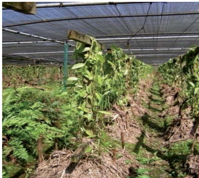
Abb. 5: Vanillefarm/Mauritius (3)

Die goldgelben Fruchtkapseln müssen im richtigen Moment, das heißt kurz vor dem Platzen gepflückt werden. Jede einzelne Pflanze muss tagelang abgesucht werden, bis alle Früchte abgeerntet sind. Es ist ein langer Weg, bis aus den duftlosen, grüngelben Schoten die schokoladenbraunen Vanillestangen mit dem betörenden Aroma entstanden sind.