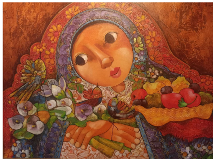
Cosecha, 100x80 cm, técnica mixta