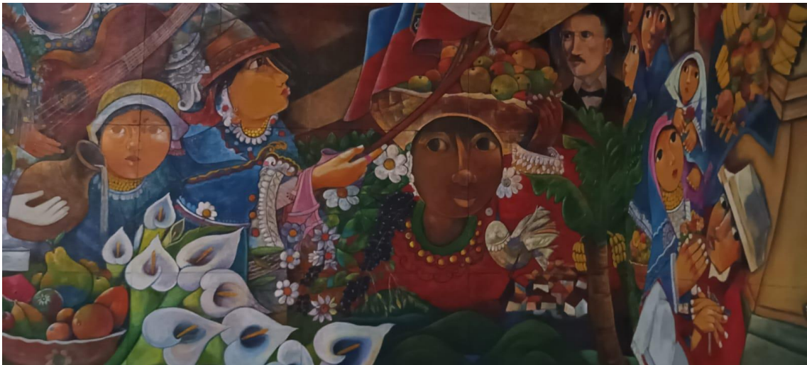
Mural Memoria y Futuro, Cotacachi