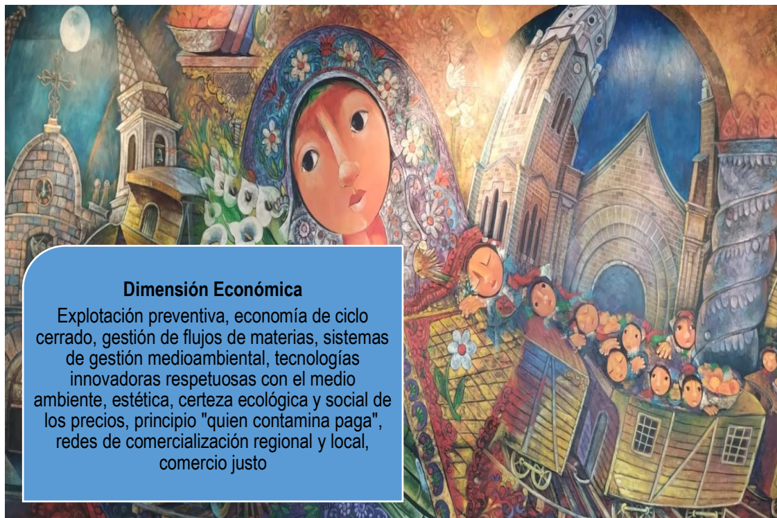
Representación del tren y los niños en el mural Tren: Destino al mar, Casa de la Cultura Benjamín Carrión, Ibarra

La dimensión económica de la sustentabilidad en el arte se refiere a la capacidad del arte para generar ingresos y ser económicamente sustentable a largo plazo, al mismo tiempo que tiene un impacto positivo en el ambiente y en la sociedad. Esto puede involucrar: el uso responsable de recursos; el fomento de prácticas laborales justas y éticas; la creación de oportunidades para la financiación; y el desarrollo de proyectos culturales y artísticos.