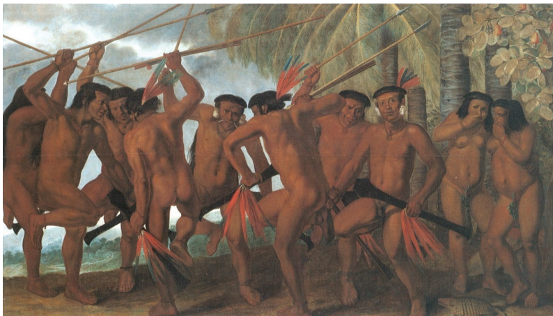
Abb. 2. Albert Eckhout, Der Tanz der Tapuya, 1646-1653, Öl auf Leinwand, 172 x 295 cm, København, Nationalmuseet, Etnografisk Samling