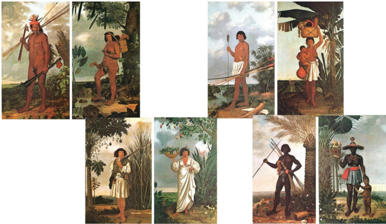
Abb. 1. Albert Eckhout, Paarbildzyklus Gesamtschau, 1646-1653, Öl auf Leinwand, København, Nationalmuseet, Etnografisk Samling