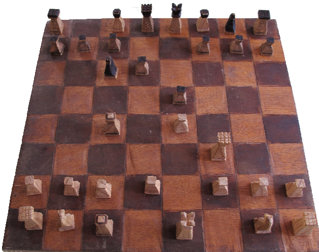
Abb. 2: Handgeschnitzten Figuren aus einem rumänischen Internierungslager um 1945 (aus dem Besitz der Familie meines Gewährsmannes). Gezeigt wird das „Schäfermatt“. Diese Figuren schnitzte sich ein Gefangener. Auch das Brett wurde aus Sperrholz herausgearbeitet.