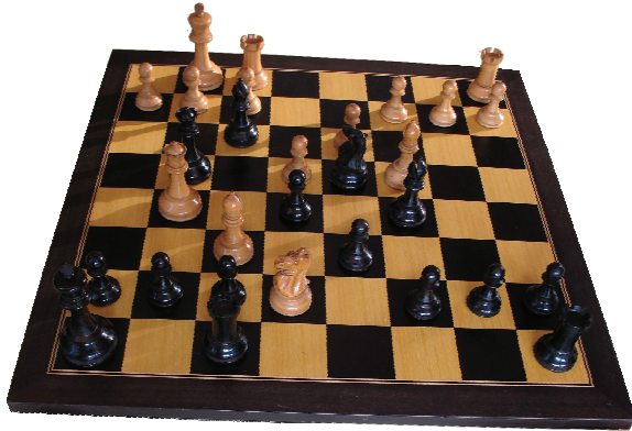
Abb. 1: Das Bild zeigt den Stand dieser „Partie“ vor dem 13. Zug. Die schönen alten englischen „Staunton-Figuren“ sind im Abendland klassisch geworden. Mit diesen Figuren spielen auch Könige. Im nächsten Zug wird Prinz Fridrich seinen Freund Katte mattsetzen.

gar, wie einer ihrer Dichter, ein gewisser Hemingway in einem Buch mit dem irreführenden Titel „Fiesta“ beschreibt, das Fortpflanzungsorgan verloren haben! Ihre Ärzte aber, so sagte mir einer, wussten schon lange: Die Wunden der Sieger heilen schneller als die der Besiegten!