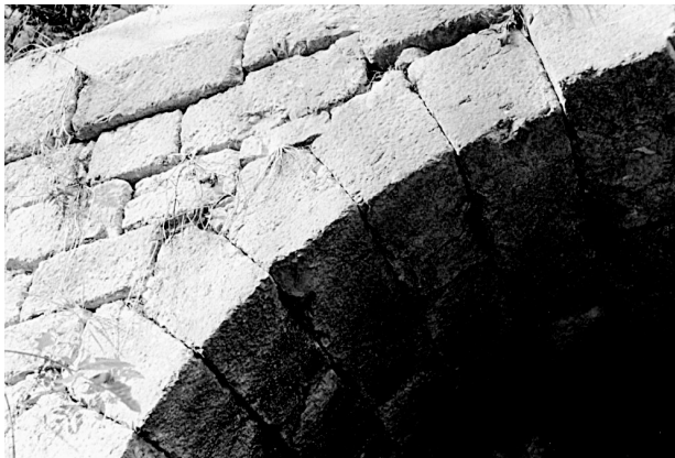
Abbildung 1: Bogenbrücke Soleleitungsweg, Quadermauerwerk

Wird die natürliche Tektonik der Gesteinsschichten im Bauwerk wiederholt, so entsteht auf diese Weise nicht nur ein Baukörper mit höchster Festigkeit sondern auch ein Bauwerk, das die Struktur der Umgebung künstlerisch rezipiert.