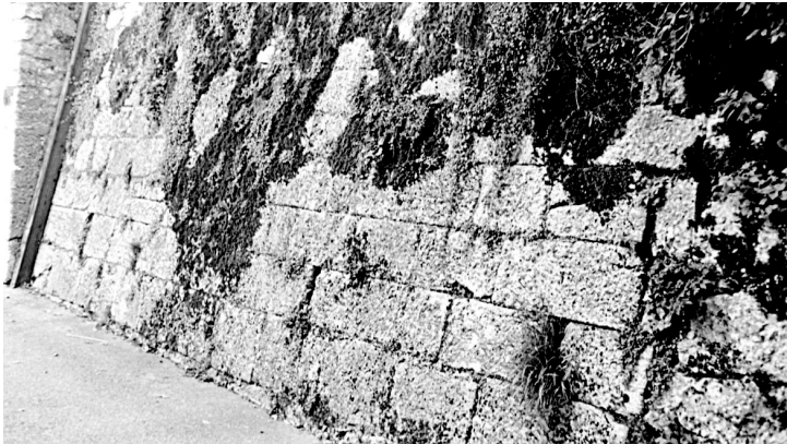
Abbildung 4: Stützmauer Hallstatt, Mortonweg.

sehr engen Fugen gemauerten Wandflächen. Alle Steine, auch die Köpfe von Bindern, liegen generell im Querformat, erscheinen daher länger als hoch und liegen meist auf ihrem natürlichen Lager auf.