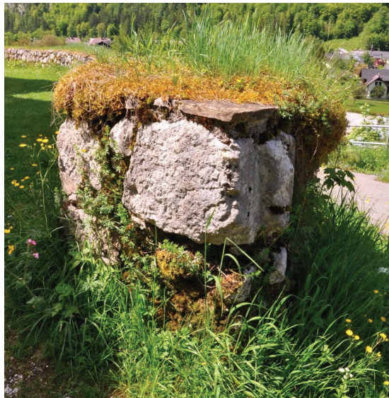
Abbildung 7: Brüstungsmauer Hallstatt, Kalvarienberg.

Brüstungsmauern sind niedrige Mauern an einer Geländekante, die als Absturzsicherung dienen. Die tatsächlich erforderliche Höhe von Brüstungsmauern hängt von deren Breite ab. Als Faustregel gilt, dass die Summe aus Höhe und Breite 110 cm betragen sollte. 5 Mit dem Auflegen von Rasensoden als Mauerkrone kann eine Brüstungsmauer auch als Rasenbank genützt werden. Traditionell wurden die Rasen in trockenen Südlagen gestochen, damit Gräser in Verwendung kommen, die bereits auf trockene Standorte konditioniert sind.