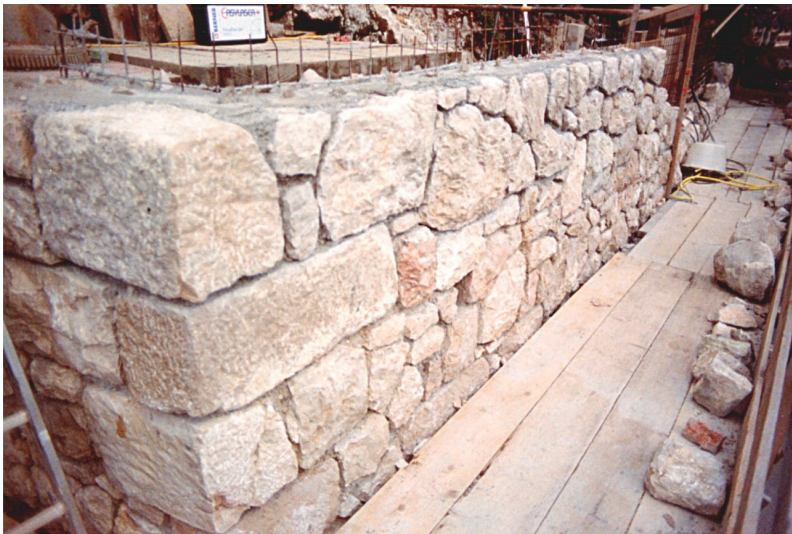
Abbildung 5: Haus Mortonweg 143, Stützmauer. Quader- und Bruchsteinmauerwerk.

Die Notwendigkeit einer sicheren Gründung lässt die historischen Steinmauern dem natürlichen Verlauf der Felsbankungen folgen, womit die Stützmauer mit ihren Knickkanten und Krümmungen das Motiv des Geländes übernimmt.