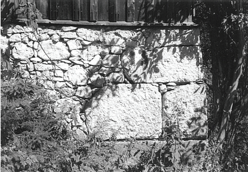
Abbildung 6: Schafferstadel Salzberg, Quader- und Bruchsteinmauerwerk, 18. Jahrhundert. Auswicklungen zwischen den Eckquadern.