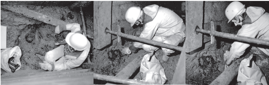
Abb. 1: Auffindungs- und Bergungssituation.

Die Durchführung der Bergung war nur unter erheblicher Rücksichtnahme auf die bautechnischen Vorgaben möglich, da ein Verzug der Arbeiten vermieden werden musste. Von einer Ausführung im Sinne einer archäologischen Plangrabung konnte daher kaum die Rede sein. Es galt, die wichtigsten Teile der Skelette zu bergen. Die Ar-