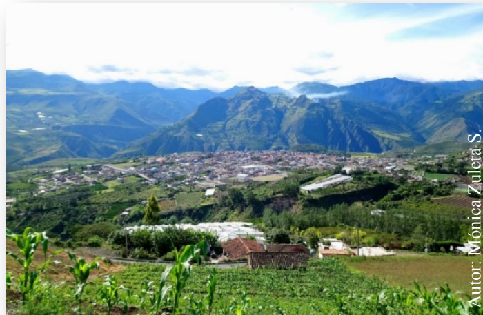
Figura 5. Vista panorámica de la ciudad de Pimampiro