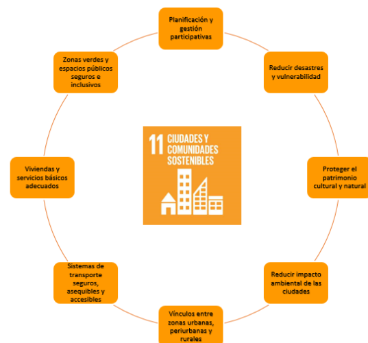
Figura 3. Objetivo 11 de Desarrollo Sostenible (Naciones Unidas, 2015)

Cada uno de los 17 ODS atiende a diferentes sectores a través de 165 metas que buscan vencer barreras para encaminar las poblaciones al desarrollo sustentable. Esta investigación aplica el Objetivo 11: Lograr que las ciudades y los asentamientos humanos sean inclusivos, seguros, resilientes y sostenibles , el cual cuenta con 10 metas que incluyen el acceso a vivienda segura, servicios básicos de calidad, transporte adecuado, salvaguardar el patrimonio cultural y natural, así como lograr un urbanismo sustentable preservando los derechos de los grupos vulnerables, ancianos, niños y mujeres, (Figura 3).