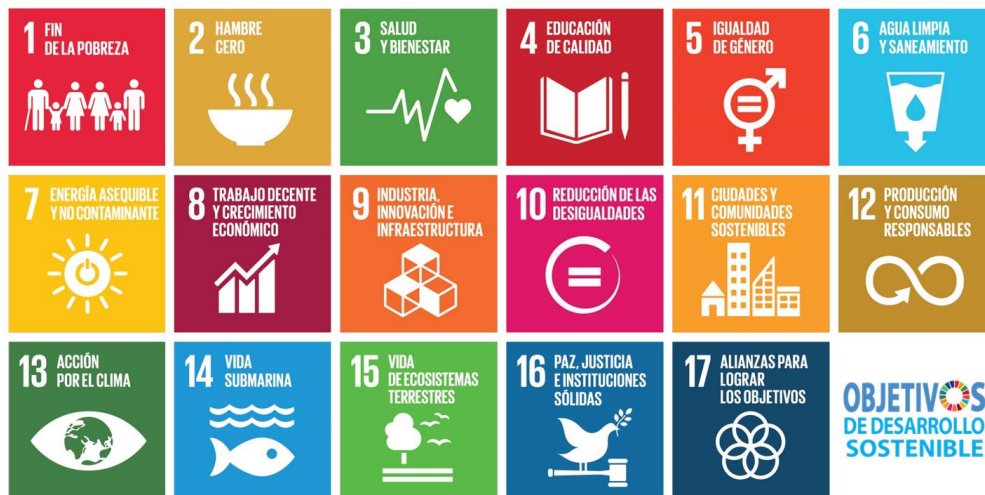
Figura 2. Objetivos de Desarrollo Sostenible (Naciones Unidas, 2015)

En el año 2015, la Asamblea General de la ONU resolvió aprobar la Agenda 2030 para el desarrollo sostenible de la ciudad y la zona rural.; para ello se propusieron los Objetivos de Desarrollo Sostenible (ODS), los cuales contienen metas de alcance mundial, aplicables de forma universal a todos los pueblos según sus diferentes realidades, capacidades y niveles de desarrollo (Naciones Unidas, 2015), (Figura 2).