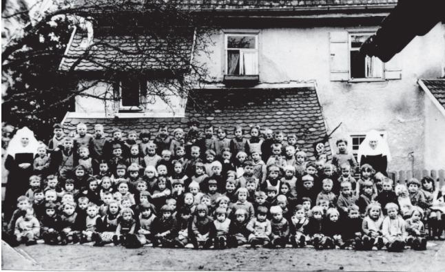
Die Hakenkreuzfahne (Pfeil) durfte nicht fehlen; Quelle: Ida-Seele-Archiv