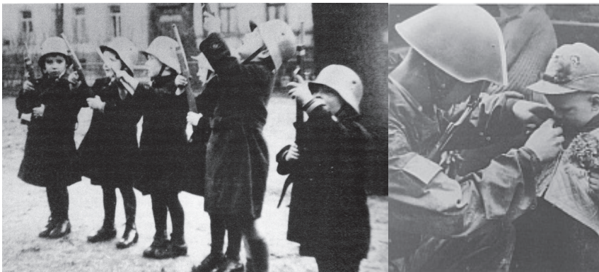
Altbewährte Wehrerziehung

missliebige Personen, insbesondere „jüdisch versippte“, aus dem öffentlichen Dienst zu entfernen. Das Gesetz gegen die Neubildung von Parteien vom 14. Juli 1933 verbot im Deutschen Reich alle Parteien neben der NSDAP. Wer die sogenannte Volksgemeinschaft als „nicht-arisch“ oder politisch unliebsam störte, wurde diskriminiert, verfolgt und sogar ermordet. Sofort begann man die „willensmäßige und geistige Einheit“ der deutschen Nation in Gang zu setzen. Bewusst und wohlüberlegt wurde diese Destination in erster Linie bei der Jugend zu erreichen gesucht, als den künftigen Trägern der neuen Volksgemeinschaft. Dazu gehörte auch die Kleinkindererziehung, deren „hohe Bedeutung... für die arteigene Volkserziehung und Durchblutung... der nationalsozialistische Staat“ (Kindergarten 1934, S. 196) erkannte.