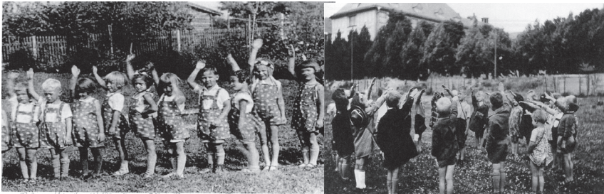
„Heil Hitler“ im Kindergarten

Neben der Vereinheitlichung der Trägerlandschaft gingen auch die Ausbildung und Weiterbildung der Kindergärtnerinnen immer mehr in die Verantwortung der Nationalsozialisten, sprich NSV, über, um eine „einheitliche Ausrichtung der weltanschaulichen und fachlichen Erziehung und Ausbildung der sozialpädagogischen Kräfte zu gewährleisten“ (Kindergarten 1936, S. 142). Zudem wurde Friedrich Fröbel, der 1840 in (seit 1911 Bad) Blankenburg den Kindergarten „stiftete“, zum „völkischen Erzieher“ stilisiert und seine Pädagogik der Nazi-Ideologie angepasst (vgl. Kindergarten 1938, S. 190 ff.).