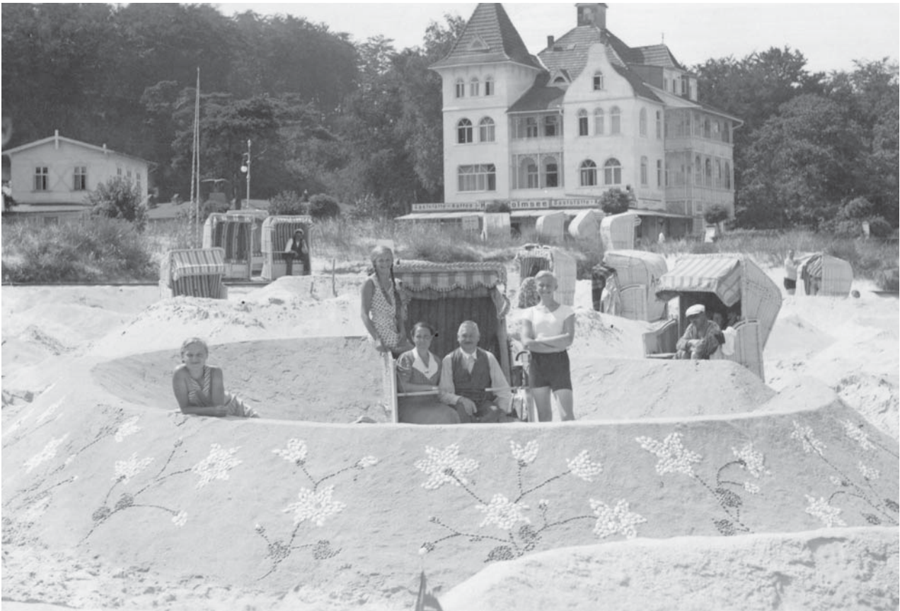
Beim Strandburgen-Wettbewerb in Binz gewannen wir einen großen Pralinenkasten.