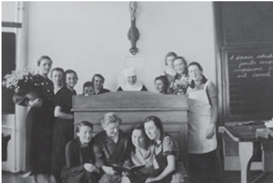
Das Kruzifix im Mittelpunkt des Unterrichtsraums im Nördlinger Kindergärtnerinnenseminar; Quelle: Ida-Seele-Archiv

„Doch welcher Spielraum konnte genutzt werden? Die Prüfungsthemen wurden weitgehend neutral gehalten. Man konzentrierte sich auf pädagogische und berufspraktische Aufgaben. Es lässt sich keine Teilnahme an dezidiert volksverhetzenden Veranstaltungen feststellen... Auch die Fotografien, die aus dieser Zeit überliefert wurden, zeigen weder NS-Symbole noch Fahnen, Uniformen oder die auch in Schulen üblichen Bilder von Hitler und anderen nationalsozialistischen Größen“ (Christeiner 2016, S. 50).