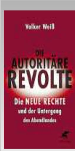
Volker Weiß, „Die autoritäre Revolte. Die Neue Rechte und der Untergang des Abendlandes“, Verlag Klett-Cotta, Stuttgart 2017, gebunden, 304 Seiten, 20,60 Euro

Schwarz-Weiß-Tönen gezeichnet werden sollten. Das Werk ist ein durchaus kenntnisreiches Buch über Geschichte und Entwicklung der politischen Rechten in Deutschland. Das Problem des Autors besteht nicht primär darin, dass er dies aus einer abgehobenen, linksintellektuellen Position heraus geschrieben hat – der Zeit-Autor Ijoma Mangold bescheinigt ihm sogar einen Ton der Betulich-