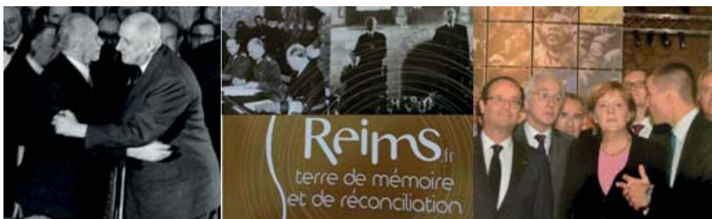
Die berühmte Accolade in der Kathedrale in Reims (08.07.1962)

Begünstigt wurde der Abschluss des Elysée-Vertrags auch durch die ersten Fortschritte in der europäischen Einigungspolitik, insbesondere durch die Gründung der Montanunion. Sie wurde konzipiert von zwei ebenfalls außergewöhnlichen Politikern: Jean Monnet und Robert Schumann. Es ging darum, mögliche Kriege zu verhindern, indem kriegswichtige Industrien auf der Basis von Kohle und Stahl einer gemeinsamen Verfügungsgewalt übertragen wurden, der Montanunion, der Europäischen Gemeinschaft für Kohle und Stahl, der neben Frankreich und Deutschland auch Italien und die Benelux-Staaten sich anschlossen (1951). Dies war ein kluger Schachzug gegen Revanchisten und mögliche Kriegstreiber, war auch ein erster Schritt auf dem Wege zur EWG, EG und schließlich zur EU, was heute vielfach gar nicht mehr bekannt oder bewusst ist, damals aber durchaus epochal war.